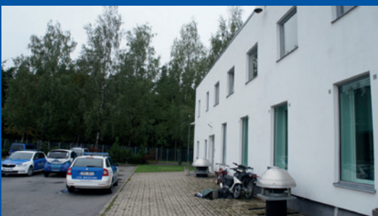
Estonia. Entrada separada en la parte trasera del Centro de Apoyo a las Víctimas de Tartumaa.

El Centro de Apoyo a las Víctimas de Tartumaa ( Tartumaa Ohvriabikeskus ) en Estonia ha habilitado una entrada separada en la parte trasera del edificio para los niños que han sufrido un trauma especialmente grave. Algunas salas de juzgados en Finlandia también cuentan con entradas separadas. Este tipo de entradas y salas de espera también son valoradas muy positivamente en los juzgados del Reino Unido.