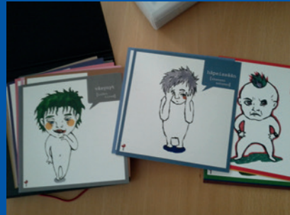
Kuovola, Finlandia. Material utilizado durante las audiencias de niños en función de su edad y de su grado de desarrollo.